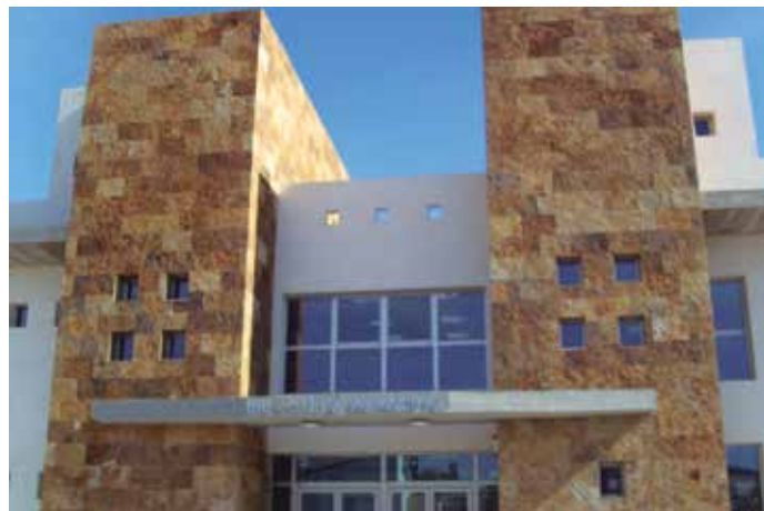
Las bibliotecas de Iurreta, Mota del Cuervo y San Javier, fueron los tres proyectos ganadores en la pasada edición