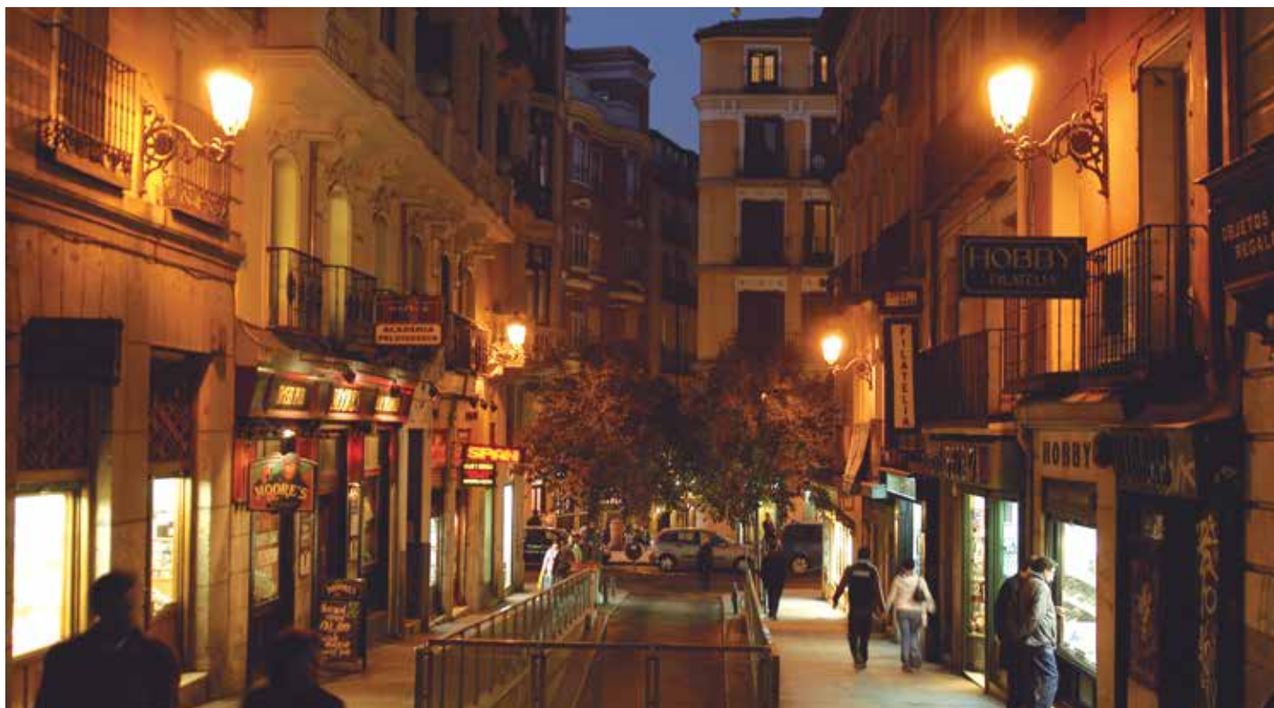
Determinados servicios clave, como el suministro de energía eléctrica, están reportando ahorros con el servicio de Afi-Fullstep

Continuando con el consumo eléctrico, en multitud de ocasiones el potencial de ahorro identificado para los asociados es mucho mayor si además de la renegociación de tarifas se acomete un proyecto de eficiencia energética, y más concretamente de renovación de infraestructura de iluminación urbana.