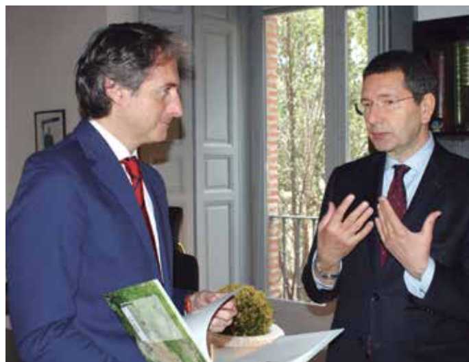
Iñigo de la Serna e Ignazio Marino, en la sede de la FEMP.

En el transcurso del encuentro, el Presidente de la FEMP le informó al Alcalde de Roma sobre los rasgos más importantes de la reforma local española reciente y, en concreto, del objetivo de delimitar competencias y evitar duplicidades entre las tres Administraciones. También destacó las cifras de superávit alcanzadas por los Ayuntamientos el pasado año y lo que estos buenos resultados han supuesto para alcanzar los objetivos de Bruselas. "Hemos salvado las cuentas del país" , le dijo textualmente.