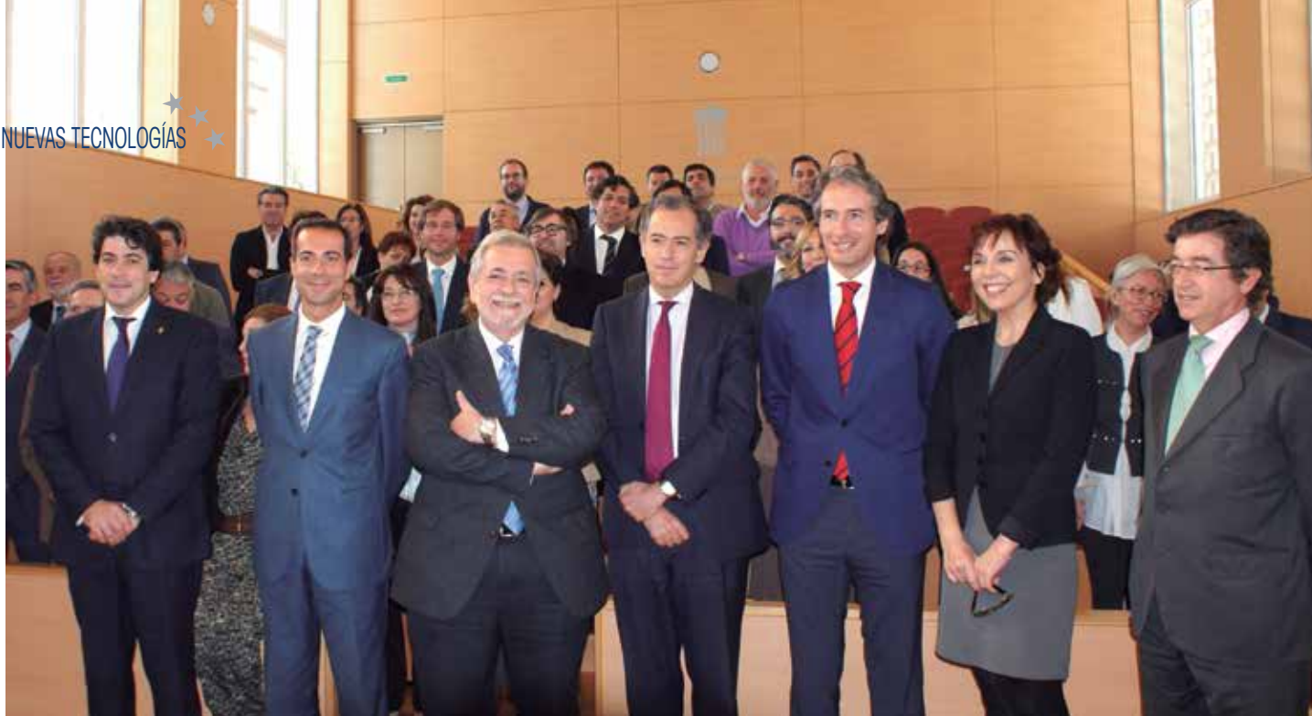
Los firmantes del protocolo posan junto a los Alcaldes de la Comunidad de Madrid.