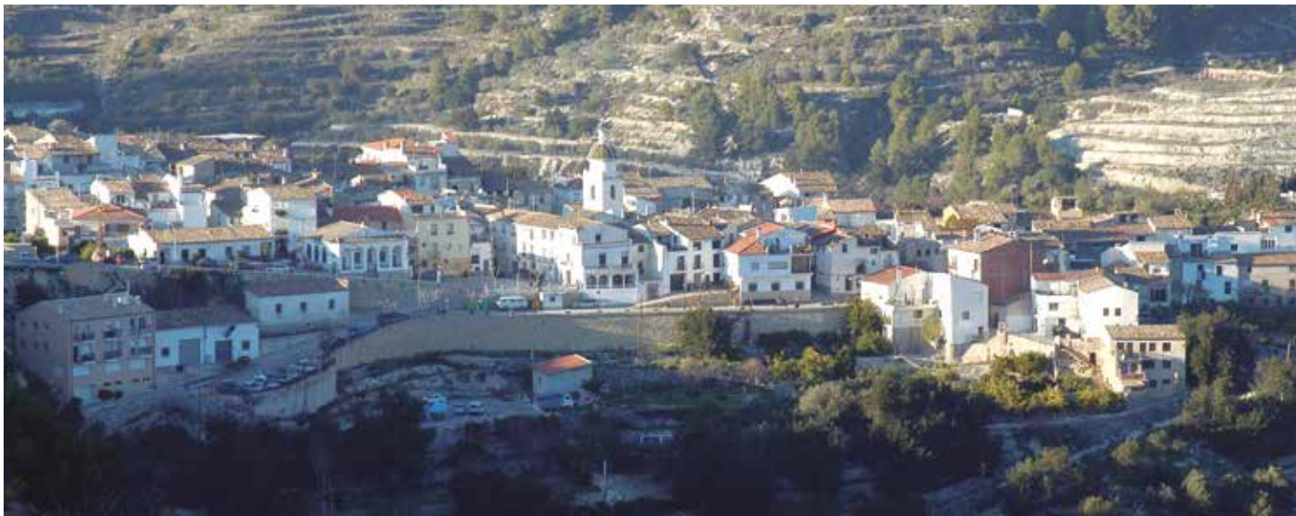
La fusión, creación y supresión de municipios son actuaciones contempladas en la reforma.

La norma también señala que las Corporaciones Locales que incumplan el objetivo de estabilidad presupuestaria, el objetivo de deuda pública o la regla de gasto, deberán formular un plan económico-financiero. Dicho plan incluirá, al menos, la supresión de aquellas EATIM que en el ejercicio presupuestario anterior no hubiesen cumplido con