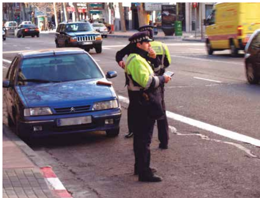
La incorporación obligatoria a TESTRA se prorroga dos años más.

La enmienda, cuya propuesta partió de la FEMP, queda recogida en la Disposición Adicional Segunda de la norma y dice, textualmente: "Las