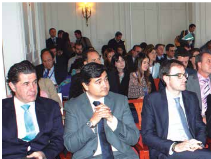
Imagen de la Asamblea 2013 celebrada en Santander.

Del mismo modo, el Alcalde de Granada ha puesto en valor la colaboración público-privada a la hora de promocionar los destinos, " esencial para emprender iniciativas ", y considera que uno de las principales trabajos de la entidad que preside es la apertura de nuevas vías de colaboración con las empresas del sector del turismo de reuniones, con el fin de impulsar la promoción de los destinos españoles a nivel internacional. ★