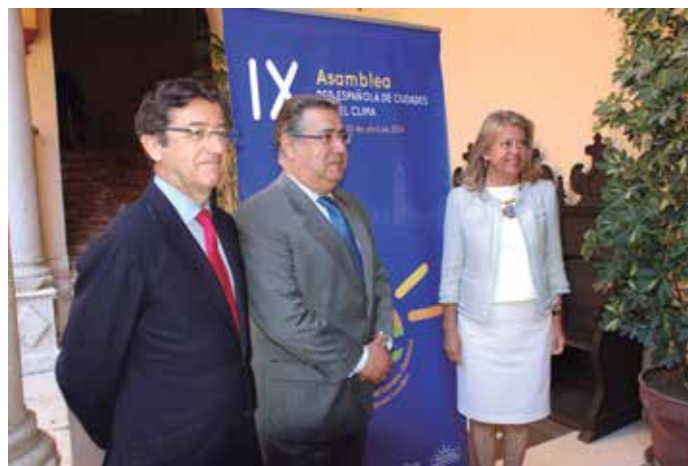
El Secretario General de la FEMP, el Alcalde de Sevilla y la Presidenta de la Red, antes de la inauguración de la Asamblea.

El respecto, mostró el compromiso de los municipios adheridos a la Red en materia de eficiencia energética, el impulso de las energías renovables, un urbanismo sostenible y una gestión razonable y eficiente de los recursos. En definitiva, por avanzar "hacia una economía baja en carbono, que genere empleo y mejore la calidad de vida de los ciudadanos" .