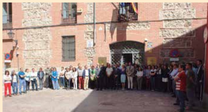
La plantilla de la FEMP también se sumó al minuto de silencio.

En nuestra próxima edición informaremos más ampliamente sobre el perfil de la fallecida.