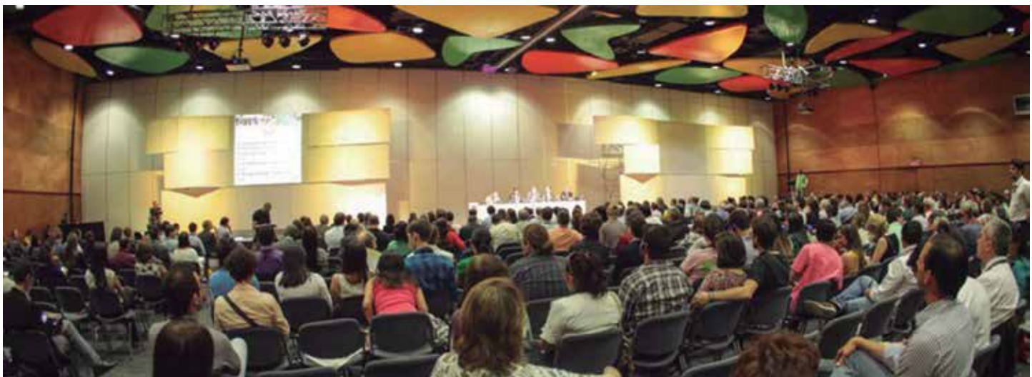
El WUF7 logró reunir a 22.000 participantes.

La próxima cita será probablemente en Ecuador, con la celebración de la Conferencia Hábitat III, que tendrá que acordar una nueva Agenda Urbana a nivel mundial con buena parte de las propuestas recogidas en el WUF7. ★