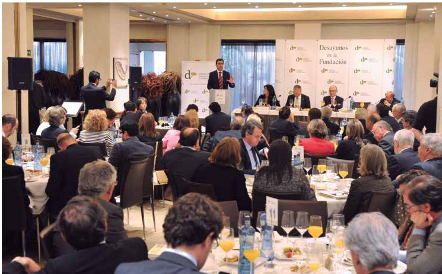
Intervención del Vicepresidente Segundo de la FEMP.

El Ministro también dio a conocer la oferta de empleo público que, entre sus prioridades, tiene el reforzamiento de funcionarios de la Administración Local con habilitación nacional. Se trata de 210 vacantes puras de funcionarios locales con habilitación nacional y 70 promociones internas que se ocuparán de las funciones de control y fiscalización interna de la gestión económico-financiera y presupuestaria, además de la contabilidad, tesorería y recaudación, funciones de importancia que garantizarán controles efectivos en la lucha contra el fraude y el control del déficit. ★