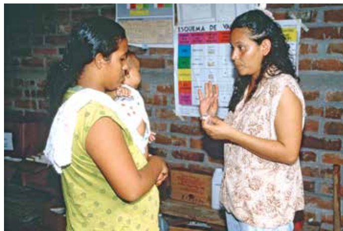
La nueva Ley pretende armonizar las políticas exteriores española y europea y lograr mayor coordinación con los Estados de Iberoamérica.

La Ley de la Acción y del Servicio Exterior del Estado tiene, entre otros, los objetivos de promover los valores y los intereses de España con el fin de fortalecer su presencia internacional y reforzar su imagen en el mundo; consolidar y reforzar la credibilidad de España en el exterior para aumentar las exportaciones y atraer capitales; y establecer el marco adecuado para garantizar una adecuada asistencia y protección a los españoles apoyando a la ciudadanía española y a las empresas españolas en el exterior. La nueva ley pretende igualmente fortalecer la participación en el proceso de integración europea y, por ello, armonizar la política exterior de España con la de la UE y lograr la mayor coordinación con los Estados que integran la Comunidad Iberoamericana de Naciones. ★