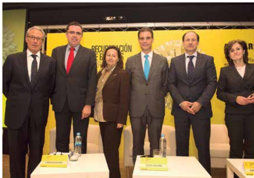
Participantes en el panel "Situación actual y perspectivas desde la Administración Autonómica y Local", tras su celebración.

La jornada conmemoraba el décimo aniversario de la constitución de la Asociación de Plantas de Recuperación y Selección de Envases de Residuos Municipales, que nació con el objetivo de compartir experiencias y conocimientos para mejorar el funcionamiento de las plantas de recuperación, su balance económico y los índices de reciclaje y recuperación. Actualmente cuenta con 20 plantas asociadas en toda España, que entre todas gestionan cada año casi 200.000 toneladas de envases. ★