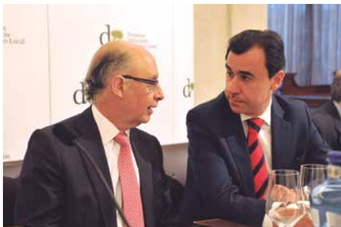
Martínez-Maillo y el Ministro Montoro charlan en los minutos previos a la Conferencia.

El Vicepresidente Segundo de la Federación, que intervino el pasado 29 de abril en la conferencia desayuno organizada por la Fundación Democracia y Gobierno Local y fue presentado por el Ministro Cristóbal Montoro, aseguró que aún queda recorrido fiscal en la participación en el IRPF e IVA de cara a la nueva financiación local y autonómica. Maillo insistió en el mantenimiento de las competencias en los municipios menores de 20.000 habitantes y en el papel coordinador de las Diputaciones, "siempre con el consentimiento de los Ayuntamientos" .