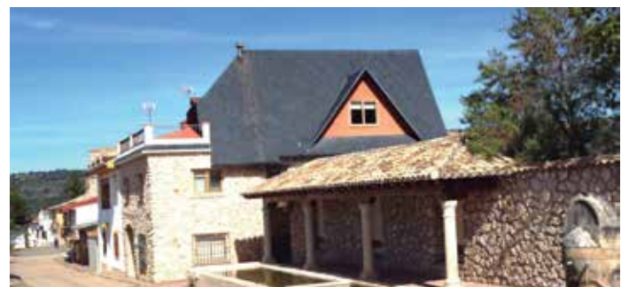
Antiguo lavadero de Castilforte (Guadalupe), de 60 habitantes.