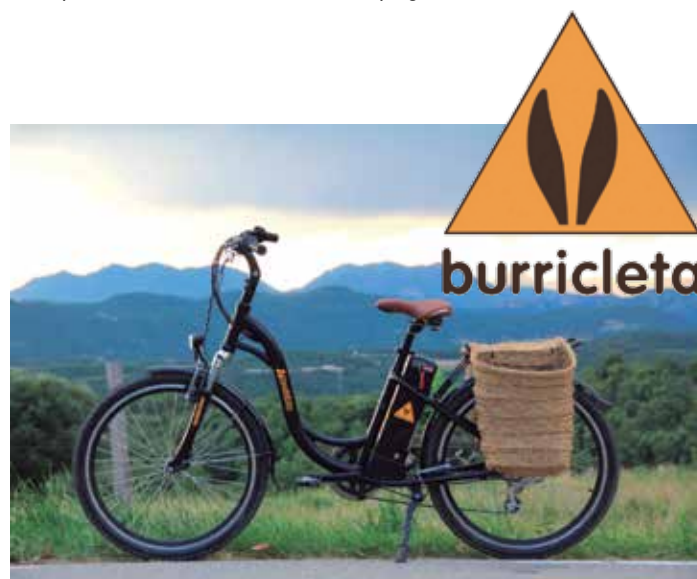
La "Burricleta", bicicleta rural eléctrica, del municipio barcelonés de Perafita.

Además de Burgos y Teruel, participan las regiones de Thessaly y Epirus, de Grecia; el Ayuntamiento de las Islas Shetland, de Reino Unido; Euromontana, de Francia; la Agencia de Innovación Transdanubiana y el Centro de Desarrollo Económico de la región de Pannon-Oeste, de Hungría; el Centro Regional de Gestión de Burgenland, de Austria; el Centro de apoyo a Negocios de Kranj, de Eslovenia; la Región de Vidzeme, de Letonia; la Región de Podkarpacie, de Polonia; y el Ministerio de Infraestructuras y Agricultura, de Alemania. ★