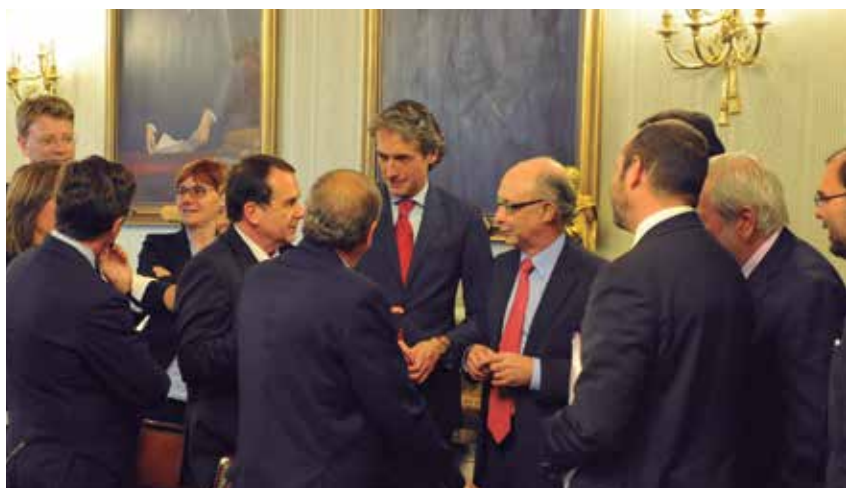
Los representantes locales junto al Ministro minutos antes de comenzar la Comisión.

En cualquiera de los tres casos, los municipios que se acojan quedarán obligados a adoptar determinadas medidas que deberán incorporar a sus planes de ajuste revisados. Esas medidas son adhesión automática a la plataforma Emprende en 3 para impulsar y agilizar los trámites para el inicio de la actividad empresarial, adhesión al punto general de entrada de facturas electrónicas de la Administración General del Estado y la sustitución inmediata de, al menos, un 30% de las vigentes autorizaciones