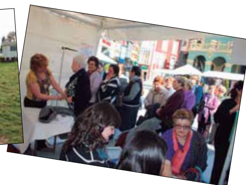
Imagen de los proyectos municipales premiados de Utebo y Palencia. A la derecha, algunas de las actuaciones de Tineo.