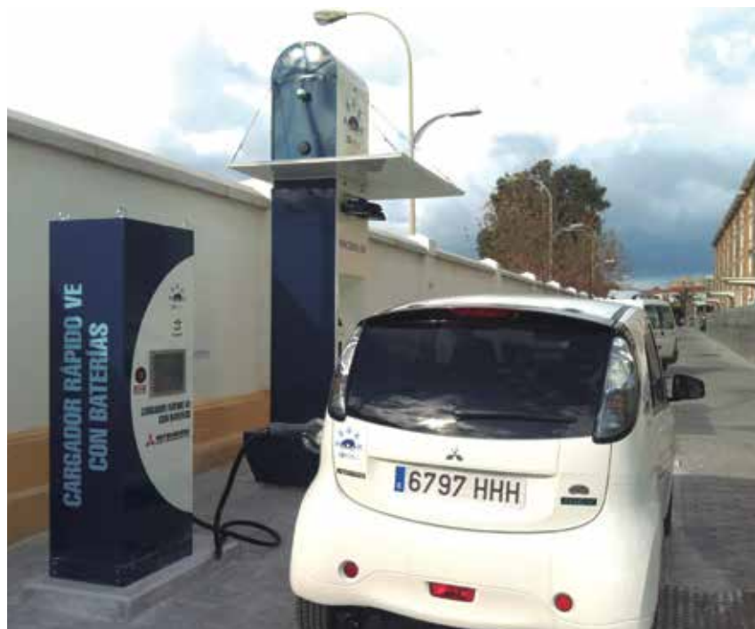
El Grupo de Movilidad Urbana aprobó un protocolo de interoperabilidad del vehículo eléctrico.

En el ámbito del turismo, se acordó la puesta en marcha de tres proyectos de smart destinations: una guía de colaboración público-privada para la promoción de un destino turístico, una relación de nuevos modelos de negocio y servicios para el antes, durante y después del