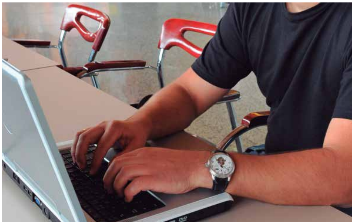
Gracias al aprovechamiento de las nuevas tecnologías, Emprende en 3 permite la creación y apertura de empresas con agilidad.