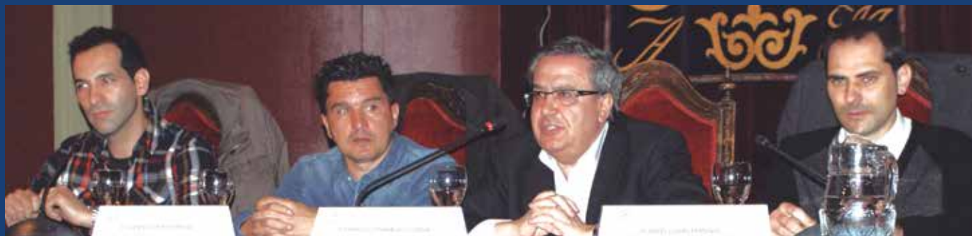
Integrantes de la Mesa Redonda sobre el Programa Agente Tutor.

Cuando tienen conocimiento de algún hecho susceptible de calificar como acoso, actúan recopilando datos para una posible denuncia o en calidad de mediadores, velando siempre por el interés del menor afectado y tratando de evitar que se produzca una victimización secundaria.