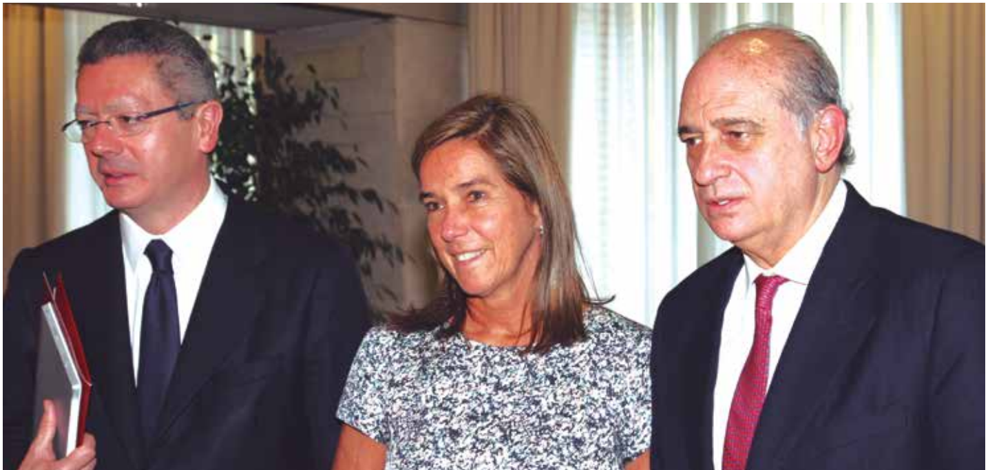
Los tres Ministros tras la reunión.

La FEMP trabajará con los Ministerios de Sanidad, Servicios Sociales e Igualdad, de Interior y de Justicia para impulsar un nuevo modelo de respuesta a la violencia de género. Así lo anunciaron los representantes de estas tres carteras tras un encuentro interministerial celebrado para reforzar los mecanismos legales y jurídicos de protección a las víctimas de la violencia de género y a sus hijos.