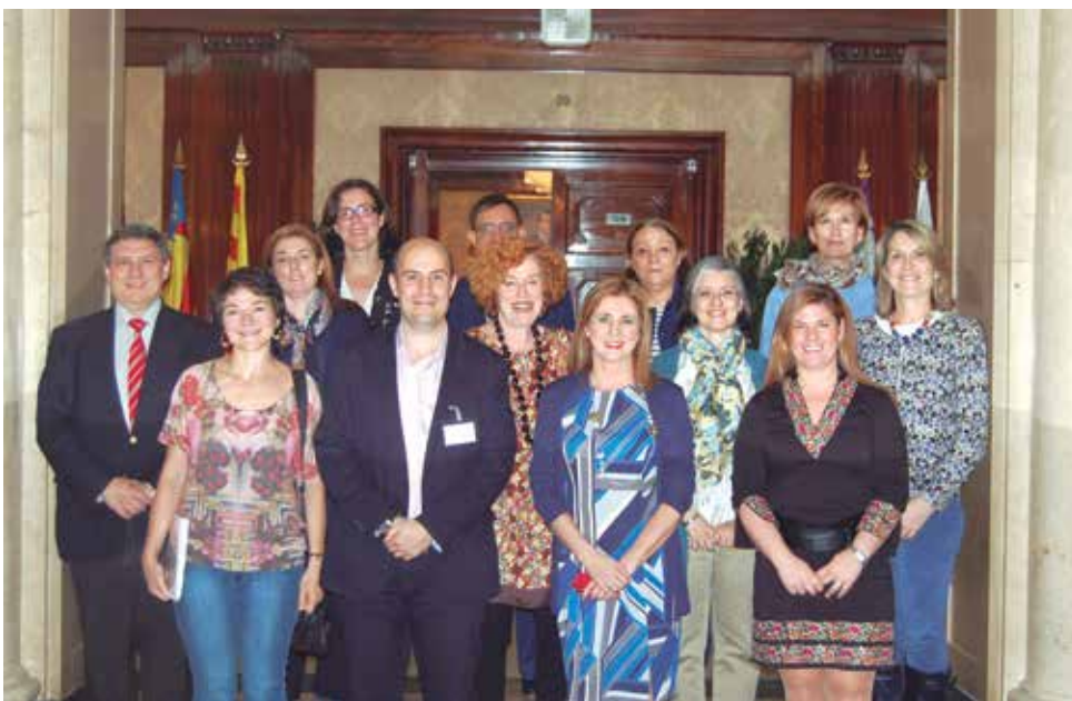
Los miembros del jurado tras finalizar las deliberaciones.

Las modalidades premiadas fueron alimentación saludable en el ámbito familiar y comunitario; práctica de la actividad física en el ámbito familiar y comunitario; alimentación saludable en el ámbito escolar; práctica de la actividad física en el ámbito escolar; ámbito sanitario; ámbito laboral e iniciativa empresarial; así como "especial reconocimiento", premio que en esta edición recayó en el doctor Carles Vallbona i Calbó por su trayectoria profesional en el campo de la medicina familiar y comunitaria, y de medicina física y de rehabilitación, con una gran trayectoria en al ámbito de la actividad física. ★