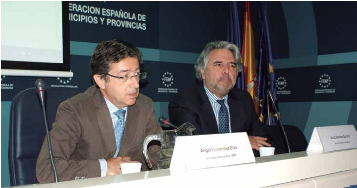
Los Secretarios Generales de la FEMP y de ATUC, en la apertura de la jornada.