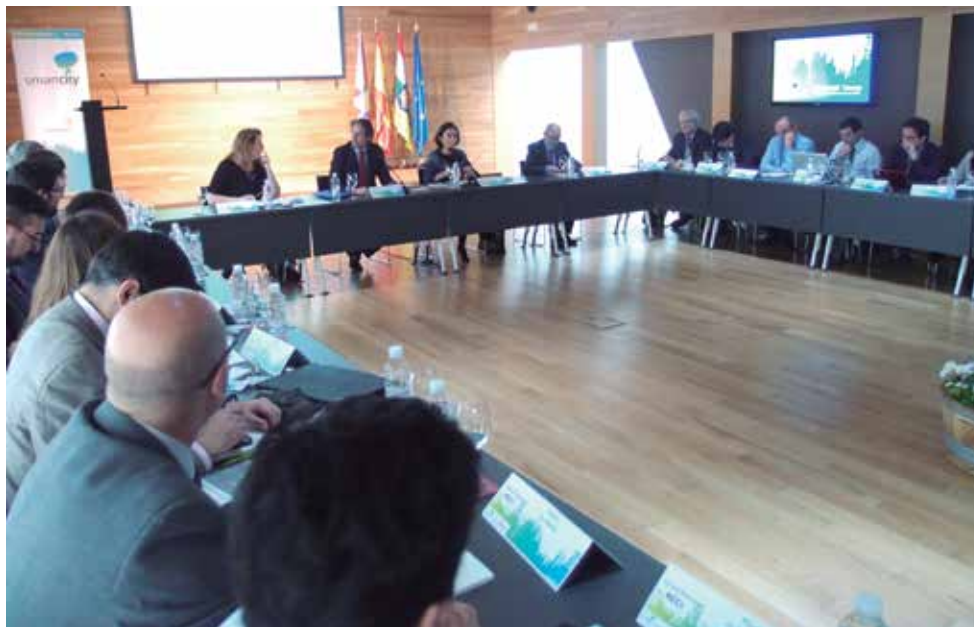
Desarrollo de la reunión, celebrada en Logroño.

Este grupo cuenta con el apoyo del IDAE y de las entidades que representan a este sector (AEDIVE y FOREVE), así como con la parti-