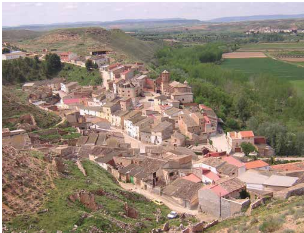
En Castelnuovo (Teruel), la alternativa elegida ha sido el taxi eléctrico.